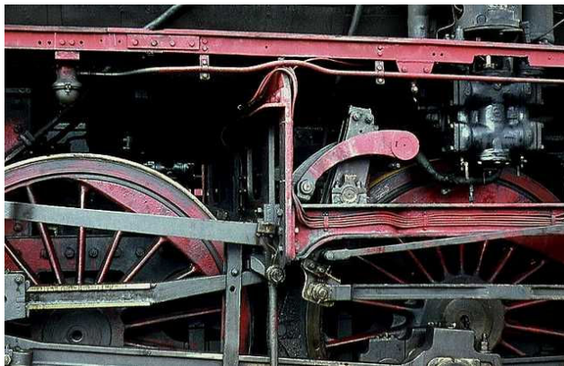
Blick auf das Außentriebwerk der Führerhausseite von 39 230. Die einzige P10 mit Hängeeisen-Steuerung ist Anfang August 1965 in Radolfzell kalt abgestellt.

Aus wirtschaftlichen Erwägungen sollte keine völlig neue Lok auf die Schiene gestellt werden, sondern vielmehr höchstmögliche Tauschbarkeit und Einheitlichkeit mit den