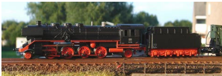
Norden – unangenehm auffallend die Sicherheitsventile, zu kleine Kuppelräder und die unmaßstäbliche Länge der Märklin-Lok 88092.

Bei der Vorbildnummer wurde dann die letzte Chance vertan: Die Lok 39 198 gehörte zu den