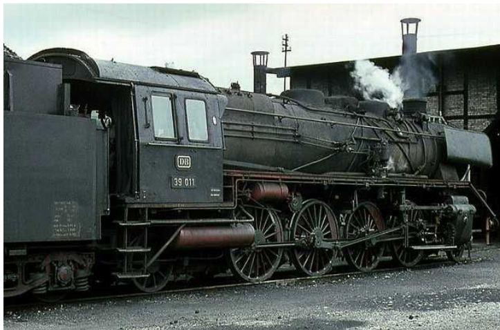
Bei diesem Vorbild wäre Märklins Modell recht stimmig gewesen (Tender, Windleitbleche und fehlende Indusi): 39 011 mit Ruhefeuer in Radolfzell (1965). Gut zu erkennen ist das gedrungene Erscheinungsbild der Baureihe 39.

Insgesamt wurden 260 Loks im Jahr 1922 (10 Vorserienloks) und von 1923 – 1927 (250 Maschinen) geliefert. Der größte Teil kam von Borsig und Henschel. In der Epoche 2 gehörten u.a. das BW Berlin Ahb (Anhalter Bahnhof) zur Heimat der BR 39, weshalb die Lok zusammen mit den vierachsigen Preußen-Abteilwagen hervorragend zum Themenschwerpunkt von Märklin passt.