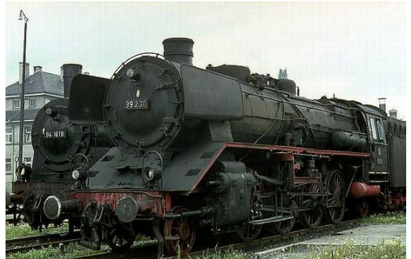
Eine von nur zwei erhaltenen 39ern: Die 39 230 überlebte eher zufällig als Kranprüfgewicht und wurde für die 150-Jahr-Feiern 1985 in Nürnberg aufgearbeitet. Man beachte den sog. „Heiligenschein“ um die Rauchkammer.

Leider blieben nicht viele Maschinen erhalten. Eine steht heute im Werksmuseum von Linke-Hofmann-Busch in Salzgitter (im nicht originalen, preußischen Anstrich). 39 230 diente als Kranprüfgewicht und entkam so nur knapp der Verschrottung, bis sie für die Jubiläumsparaden 1985 in Nürnberg in einen vorzeigbaren Zustand zurückversetzt wurde und wieder einen Ursprungstender erhielt.