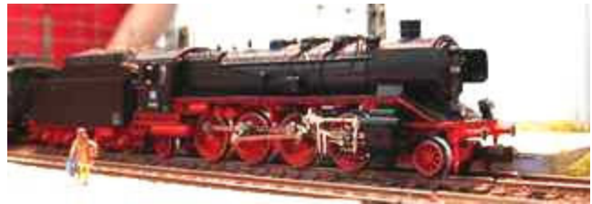
Ein Beispiel für ein gelungenes Modell der preuß. P10: BR 39 der DB in Ausführung mit Witte-Blechen und preußischem Tender 2'2' T 31,5 von Fleischmann im Maßstab 1:160.

Schon meine Einleitung macht deutlich, dass ich nicht von Begeisterungstürmen erfasst werde, wenn ich mir das Märklin-Modell der BR 39 im Maßstab 1:220 anschau. Seit einigen Wochen wird unter der Artikelnummer 88092 diese Lok als Epoche-3-Modell in Ausführung mit Witte-Windleitblechen und Einheitstender 2'2' T 34 der Deutschen Bundesbahn ausgeliefert.